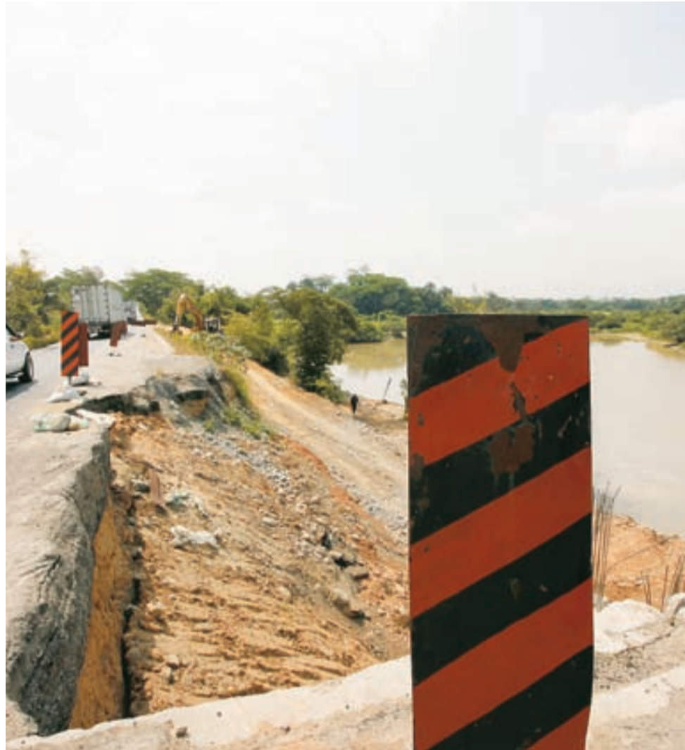
ESTE ES EL CASO DE LA CARRETERA Coatzacoalcos-Villahermosa

En lo que va del año, la SCT ha invertido unos 400 millones de pesos en la rehabilitación de las vías de comunicación federales del sur, restando unos 80 millones para los últimos tres meses del año.