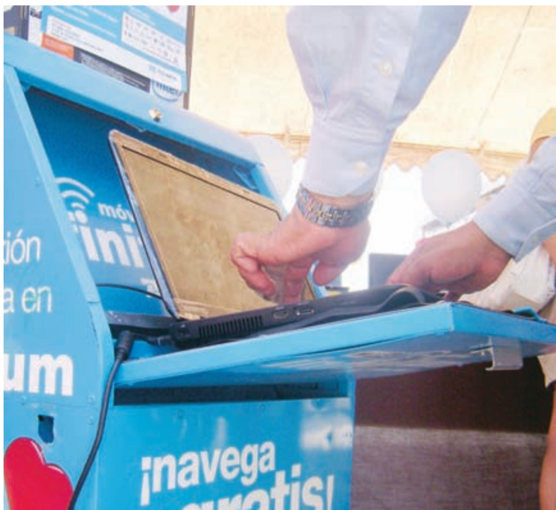
SE DESCONOCE CUÁNTAS CASSETAS TELEFÓNICAS hay en Xalapa, señaló el director de Desarrollo Urbano del Ayuntamiento