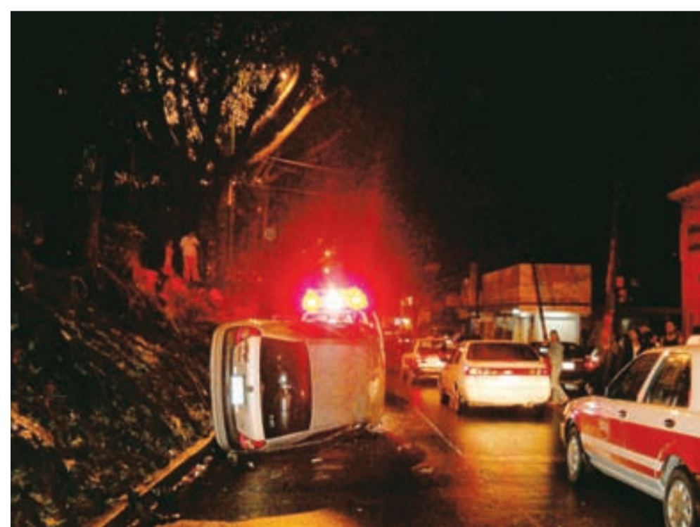
ESTE ES EL auto Renault tipo Clío, que fue volcado por su conductor sobre Maestros Veracruzanos.