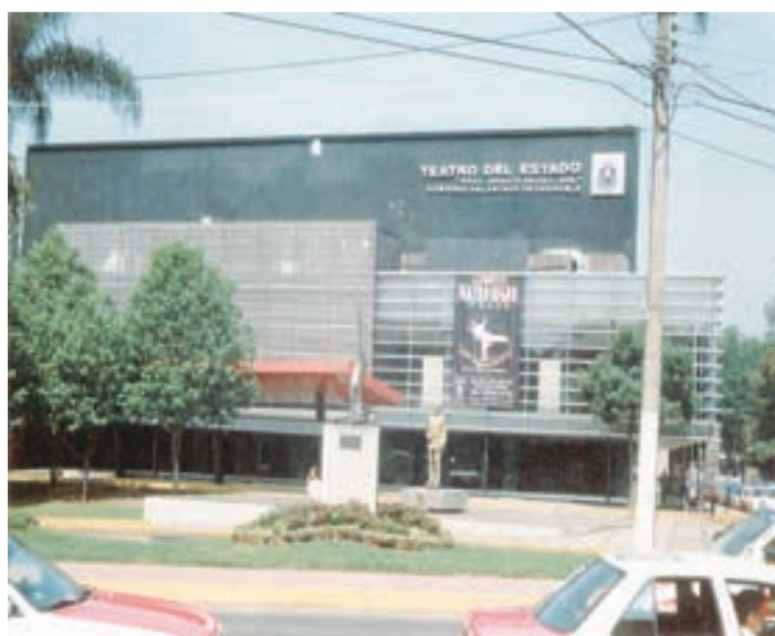
TEATRO del Estado "Gral. Ignacio de la Llave". (Ceja García).